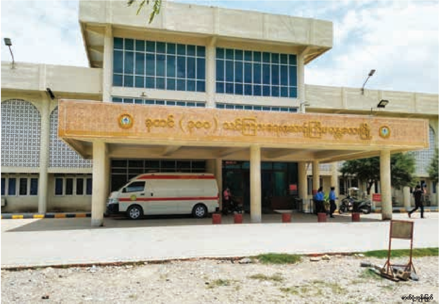
ဓာတ်ပုံတန်းမြတ်

“ကန်တော်နဒီဆေးရုံမှာ ICU အခန်းက အဆင်သင့်ရှိပြီးဖြစ်တာကြောင့် ICU Care (အထူးကြပ်မတ်စောင့်ရှောက် ကုသဖို့) လိုအပ်တဲ့လူနာတွေကို ကန်တော် နဒီမှာပဲ လက်ခံကုသမှာဖြစ်တယ်။ ခုတင် ၃၀၀ မှာ ICU အဆင့် အတည်ပြုလူနာ တွေကို ကုသစောင့်ရှောက်ပေးနိုင်ဖို့ပြင်