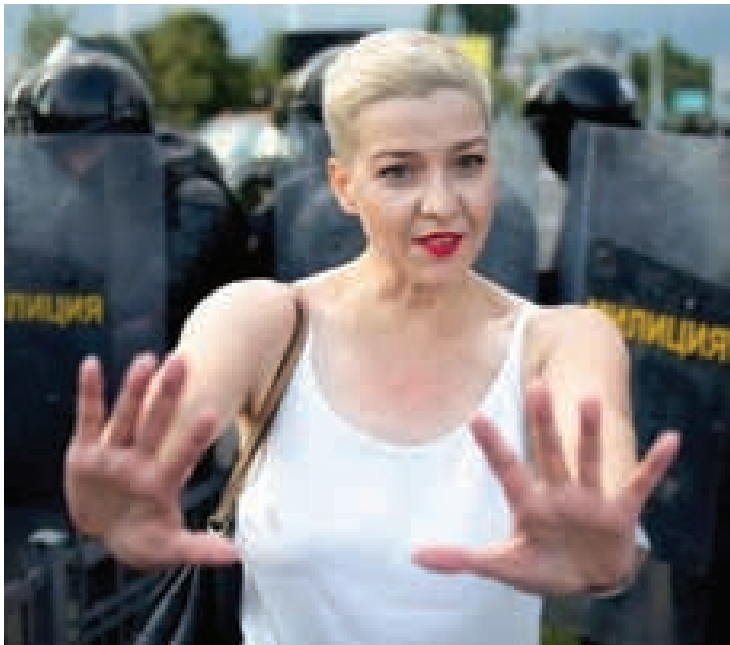
လူထုအုံကြွမှုများကိုဦးဆောင်သူ အမျိုးသမီးသုံးဦးရှိသော်လည်း သူမမှာ ပြည်ပသို့ထွက်ခွာမသွားသည့် တစ်ဦးတည်းသောသူလည်းဖြစ်သည်