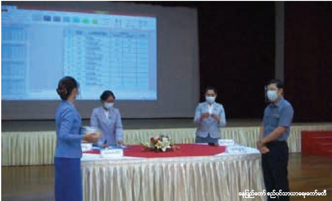
နေပြည်တော် စည်ပင်သာယာရေးကော်မတီ