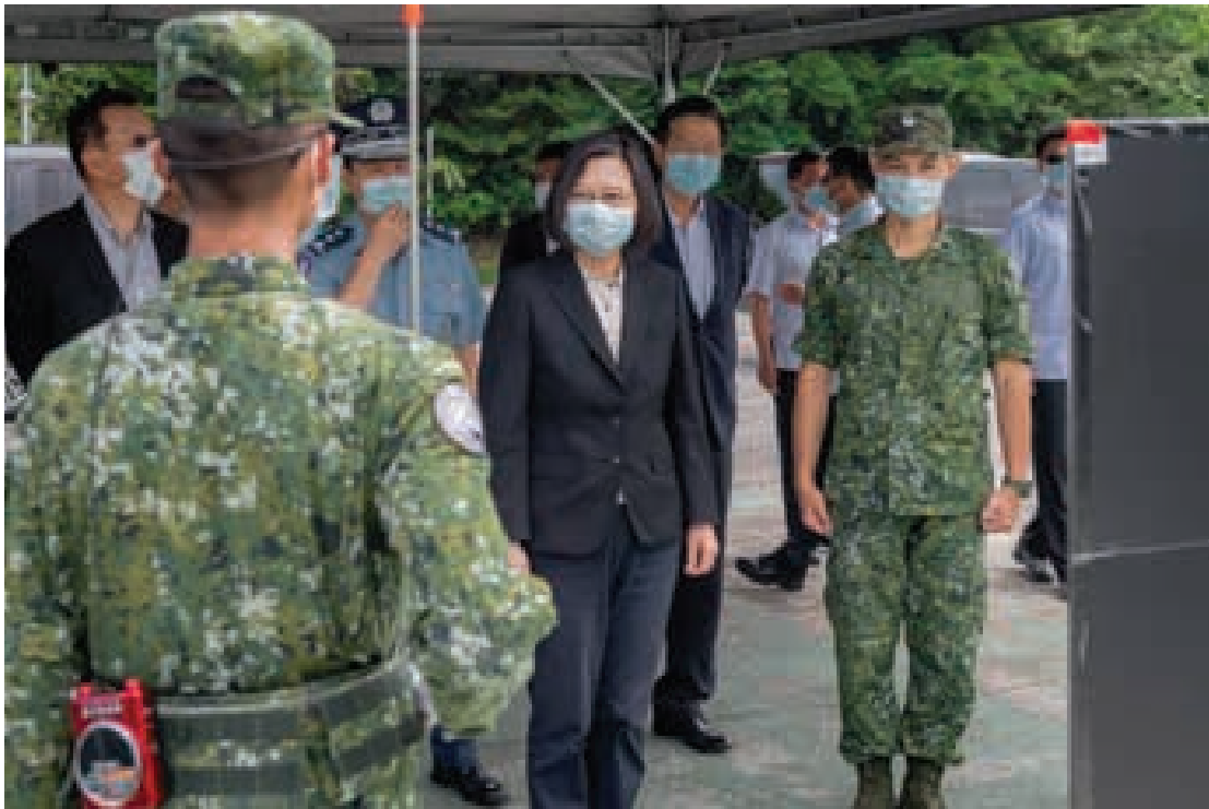
ဒုံးကျည်ကာကွယ်ရေး အခြေစိုက်စခန်းတစ်ခုသို့ သွားရောက်စစ်ဆေးခဲ့သည့် ထိုင်ဝမ်သမ္မတ ဆိုင်အင်းဝမ်ကို တွေ့ရစဉ်