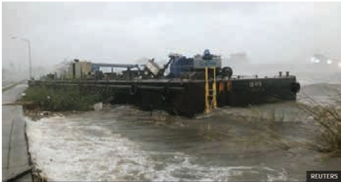
လူတစ်ဦး သေဆုံးပြီး ရေလွှမ်းမိုးဧရိယာများမှ ပြည်သူပေါင်းရာနှင့်ချီ၍ ကယ်ထုတ်ခဲ့ရသည်