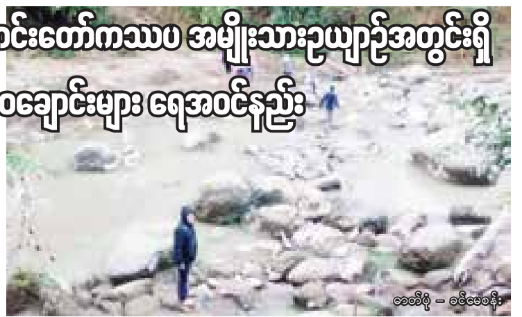
ခေတိရီ - ခေတိရီ

မြန်မာနိုင်ငံအလယ်ပိုင်းတွင် ယခု နှစ်မိုးရာသီကာလ၌ မိုးရွာသွန်းမှု နည်း ပါးခဲ့သဖြင့် ယင်းမာပင်ခရိုင်အတွင်းရှိ အလောင်းတော်ကဿပ အမျိုးသား ဥယျာဉ်ရှိ ရေဝေချောင်းများအတွင်းသို့ ရေအဝင်နည်းနေသည်ဟု ၈ ၁၅ သို့