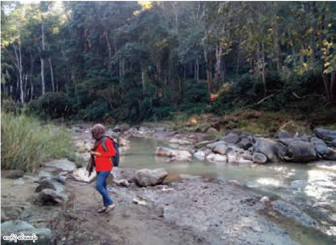
ဓာတ်ပုံ-ခင်မေစန်း

ပြောကြားသည်။ “ဒီနှစ်မှာ မိုးများများမရွာဘူး။ ကပိုင်ချောင်းက ကမ်းလုံးပြည့်စီးဆင်းတဲ့အခြေအနေကနေ ရေစီးနည်းတဲ့အနေအထားရောက်နေပြီ။ အမျိုးသားဥယျာဉ်ကိုပတ်ဝိုင်းနေတဲ့ သစ်တောကြိုးပိုင်းကြီးတွေမှာ တောပါးသွားတော့ ရွာတဲ့မိုးရေကို ထိန်းမထားနိုင်ဘူး။ ချောင်းတွေရေနည်းနေတယ်” ဟု ၎င်းက ပြောဆိုသည်။ ယင်းသို့ရေဝင်နည်းသဖြင့် သားရိုင်းတိရစ္ဆာန်များ ရေပြဿနာကြုံနိုင်သည့်အပြင် ရေရှိရာနေရာသို့သွားရာမှ နယ်ကျွံကာ ချောက်ကမ်းပါးမှ ပြုတ်ကျခြင်း၊ လူများထောင်သည့် ထောင်ချောက်မိခြင်းတို့ကြောင့် ဗိုင်းသတ္တဝါများ လျော့နည်းလာရသည်ဟု ဦးစီးအရာရှိက ထပ်မံပြောဆိုသည်။ ○ R-08